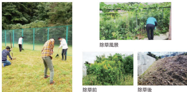
仙台村田製作所_除草作業 カメイ 所有敷地外周部_除草作業

企業・団体が管理する敷地内の除草作業を就労継続支援事業所等が行います。刈払機取扱作業者の安全衛生教育を受けた職員を有する事業所もあるため、機械を使った除草作業も可能です。