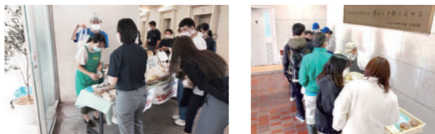
アイリスオーヤマ_パン販売 東北学院大学_パン販売

就労継続支援事業所等が企業・団体等に訪問し、パンや焼き菓子、雑貨などの商品を販売します。事業所の利用者も訪問するので社員・職員の方と障害のある方のふれあいにもつながります。