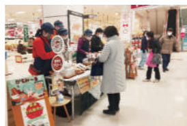
イオン東北_店舗内販売会

就労継続支援事業所等が企業・団体等に訪問し、パンや焼き菓子、雑貨などの商品を販売します。事業所の利用者も訪問するので社員・職員の方と障害のある方のふれあいにもつながります。