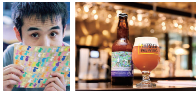
東北大学_115周年記念プレミアムビール「Kawatabi Berry」_ラベルデザインとして障害者アートの採用

障害者アートを企業・団体の商品ラベルのデザインやイベントポスターの一部として採用する取り組みです。固定概念に縛られない自由な発想が表現されているその絵は、見る人を「ほっこり」させます。