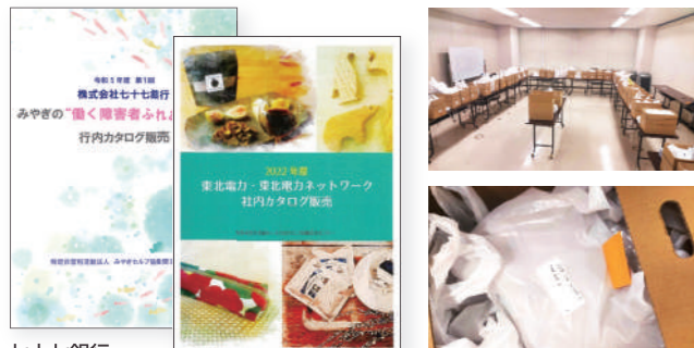
七十七銀行 東北電力 商品仕分け後の様子

就労継続支援事業所等の商品を掲載した商品カタログを作成し、一括注文する取り組みです。多くの企業・団体に取組んで頂いています。