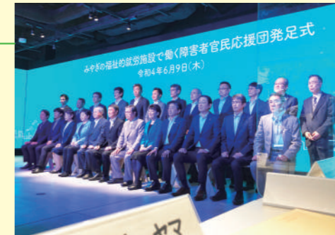
発足式の様子(令和4年6月9日(木))

令和4年6月9日CROSS B PLUS(仙台市青葉区)にて「みやぎの福祉的就労施設で働く障害者官民応援団」発足式を開催しました。会長の村井嘉浩宮城県知事を始め、趣旨に賛同する21の幹事企業・団体等および、顧問として日本財団が参加しました。